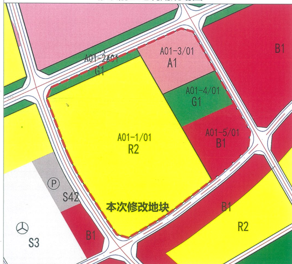
修改前土地利用规划图